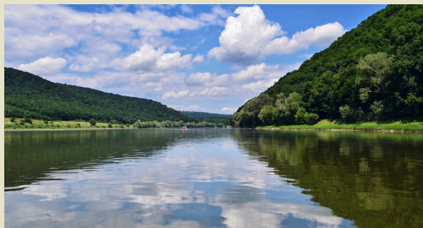
Дністровський каньйон