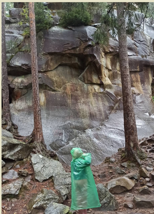
Скелі Довбуша

не засмучуйтесь, що обіцяні краєвиди не на першому кроці. Спочатку ліс, дерева, пісок і камені. Подекуди зустрічаються